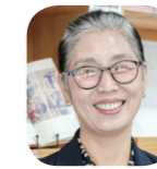
형양자 회계감사 10차 108인 나눔카페 대표