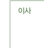
김진 이사 2차 108인 연세대 명예교수