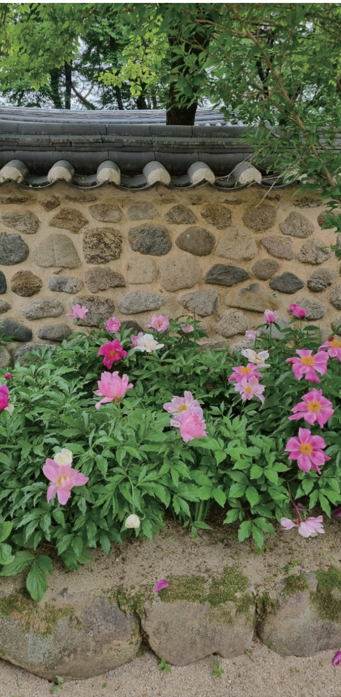
소수서원 담장 아래에는 옛 宿水寺의 향기가