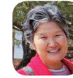
노인자 다문화행복가족센터장 5차 108인 종로우수협회 대표