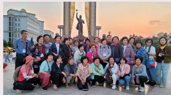
이스마일 소모니 기념비 앞에서