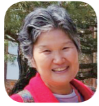
노인자 부원장 5차 108인 종로우수협회 대표