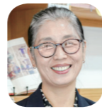
형양자 회계감사 10차 108인 나눔카페 대표