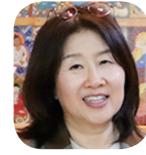
정형은 부원장 8차 108인 사카디테크리아 공동대표