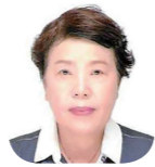
원유자 이사 4차 108인 대불련총동문회 상임교문